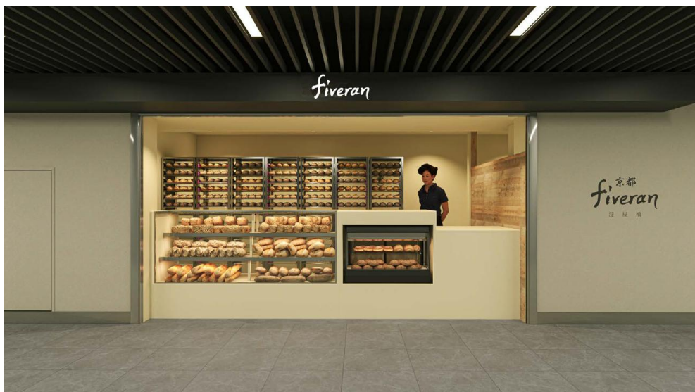
▲2025 年 12 月 19 日開業予定 「京都 fiveran 淀屋橋」パースイメージ

2025 年 12 月 19 日(金)に先行開業として、京都のベーカリー「fiveran(ファイブラン)」が駅ナカ初出店を予定。その後、2026 年 1 月下旬～2 月上旬に3テナントが開業予定です。テナント詳細は以下の通りでございます。